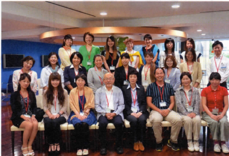
2014年7月17日（木）・18日（金）の2日間、日本能率協会研修室にて、「女性農業次世代リーダー育成塾」第1回研修が行われました。（写真は、7月17日に行われた研修の様子）